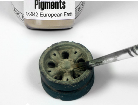
Vidd fel a pigmentet egy tiszta, száraz ecset segítségével.