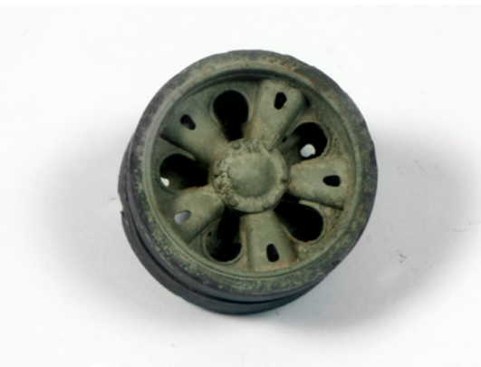
A teljes száradás után olaj és zsírfoltokat is készíthetünk.