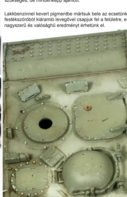
Lakkbenzinnel kevert pigmentbe mártjuk bele az ecsetünket, majd a festékszóróból kiáramló levegővel csapjuk fel a felületre, ezzel nagyszerű és valóságos eredményt érhetünk el.