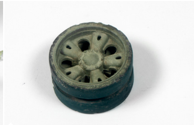
A teljes száradás után láthatóvá válik a hatás. Ennek a keréknek poros megjelenését kölcsönöztük a sarkokban felhalmozódott szennyeződésekkel.