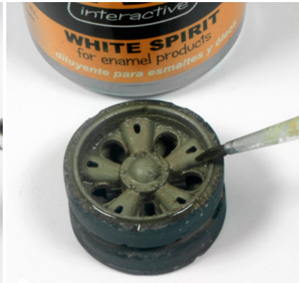
Rögzítsd azokat a helyükön némi lakkbenzinnel, vagy pigment fixálóval, majd tedd félre és hagyd alaposan megszáradni.