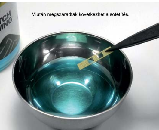
Miután megszáradtak következhet a sötétítés.