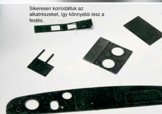
Sikeresen korrodáltak az alkatrészeket, így könnyebb lesz a festés.