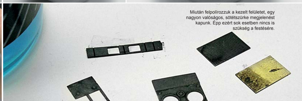
Miután felpolírozzuk a kezelt felületet, egy nagyon valóságos, sötétszürke megjelenést kapunk. Épp ezért sok esetben nincs is szükség a festésre.