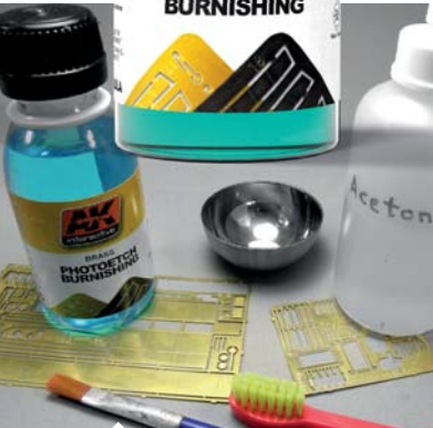
A szükséges anyagok.