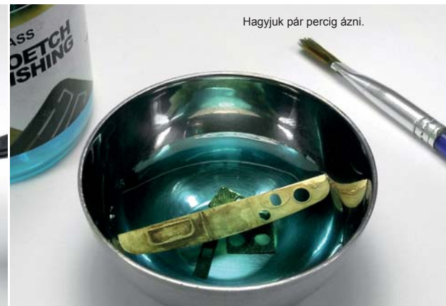
Hagyjuk pár percre ázni.