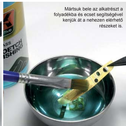
Mártuk bele az alkatrészt a folyadékba és ecset segítségével kenjük át a nehezen elérhető részeket is.