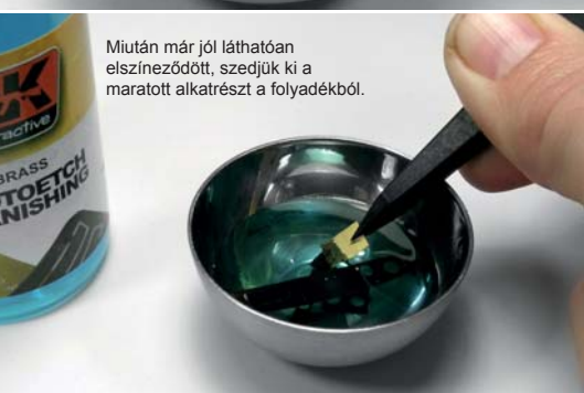
Miután már jól láthatóan elszíneződött, szedjük ki a marott alkatrészt a folyadékból.