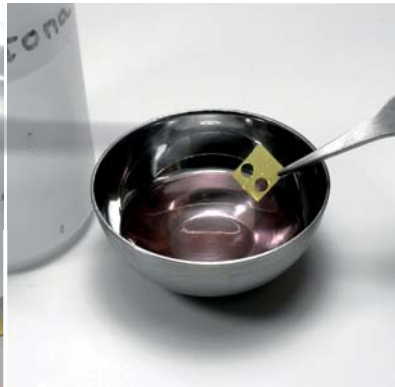
Vágjuk le a marott alkatrészeket és tisztítsuk meg őket acetonnal.